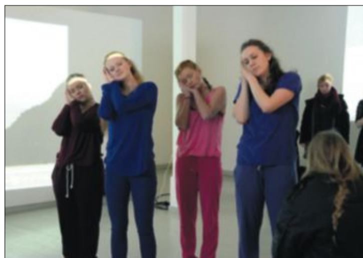
NON STOP: 2. klasse på Dahlske fremførte stykket sitt kontinuerlig under hele happeningen.